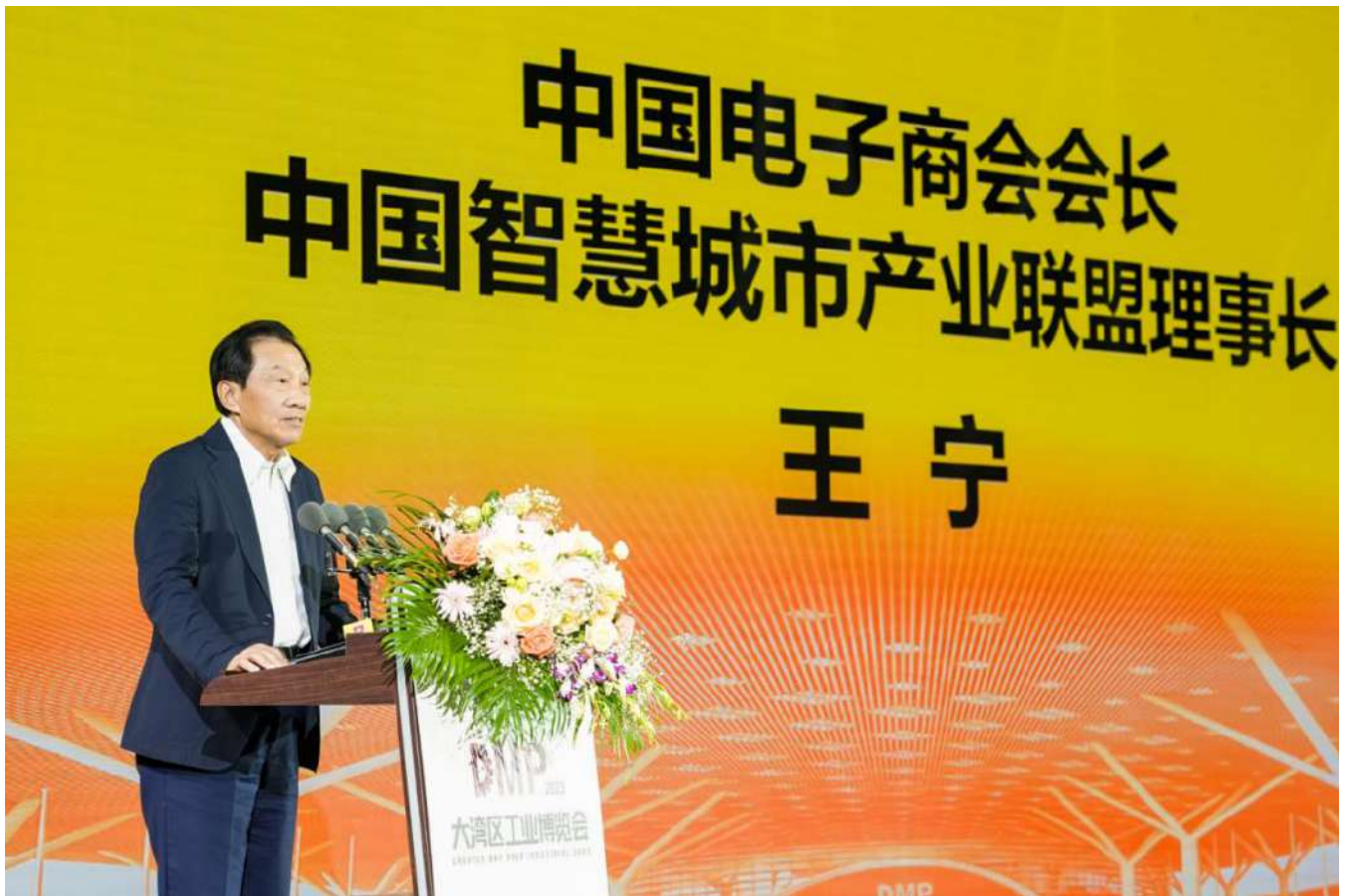
(中国电子商会会长中国智慧城市产业联盟理事长王宁先生)